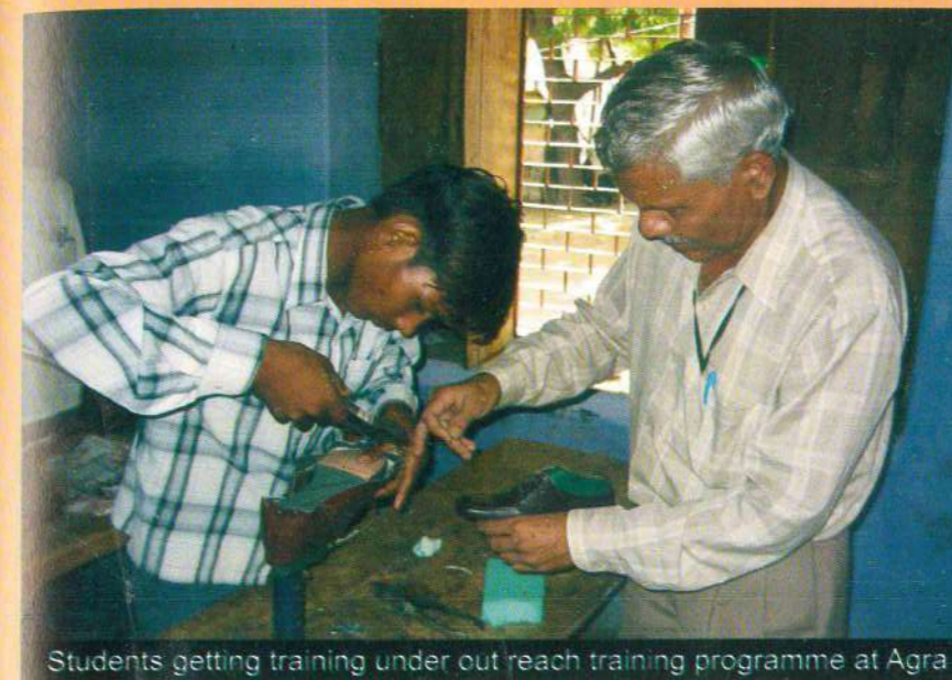
Students getting training under out reach training programme at Agra