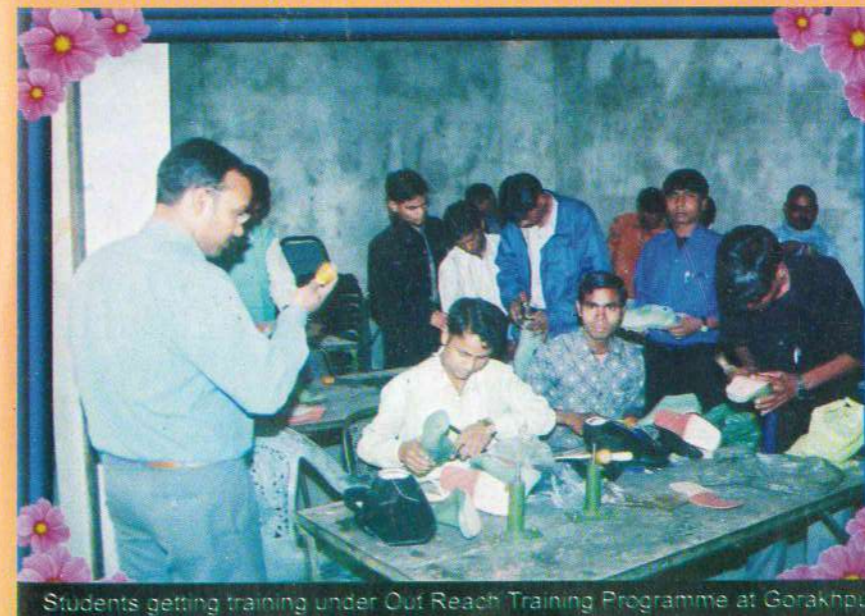
Students getting training under Out Reach Training Programme at Gorakhpur